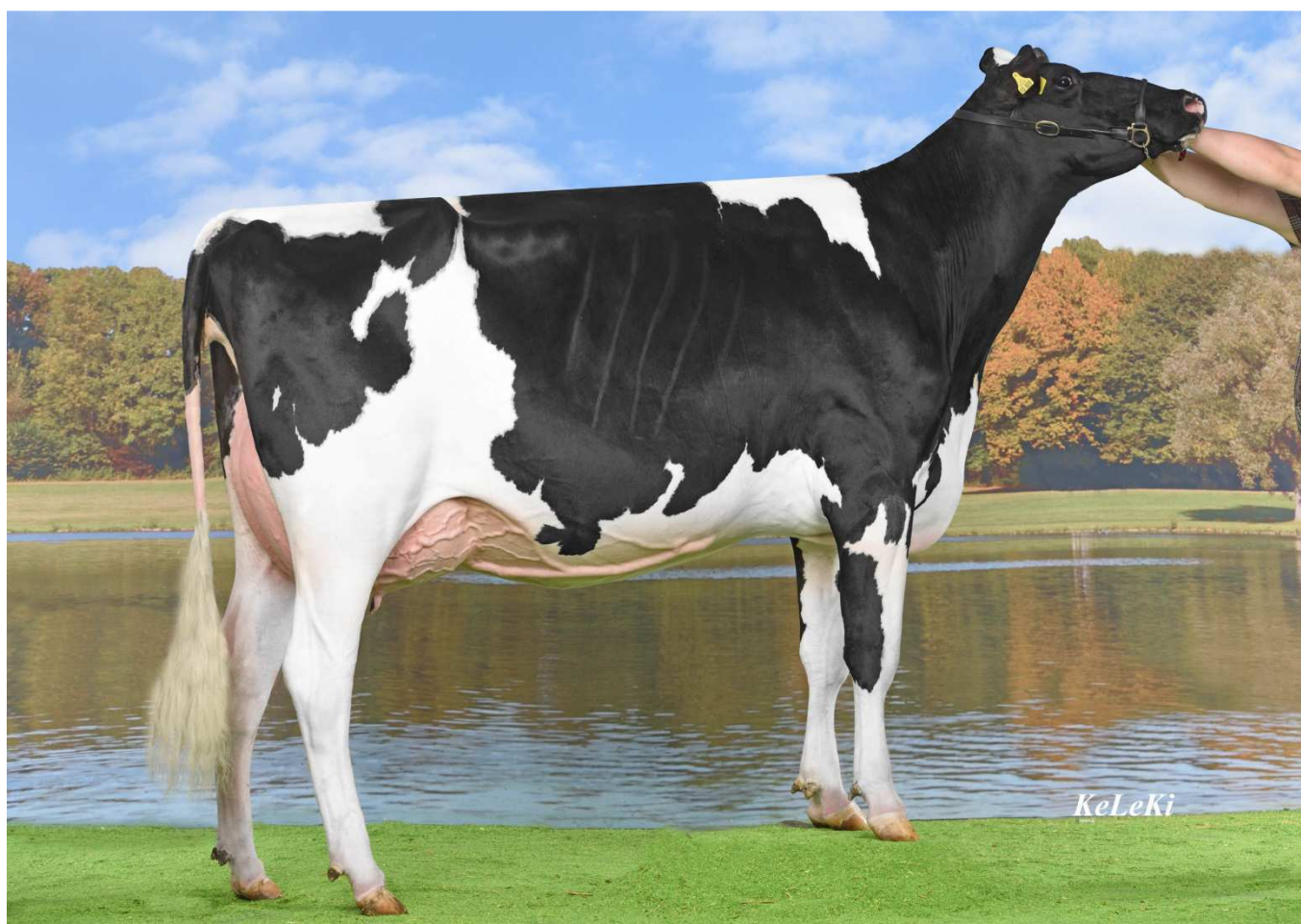
Supershot-Tochter COL Judy (1) VG86 – 1f DHV-Schau, 1b RUW-Schau – Lüpschen GbR

Zusätzlich wurden 7 (8) Fleckviehbewertungen, sowie 80 (41) Fleischrinderbewertungen durchgeführt.