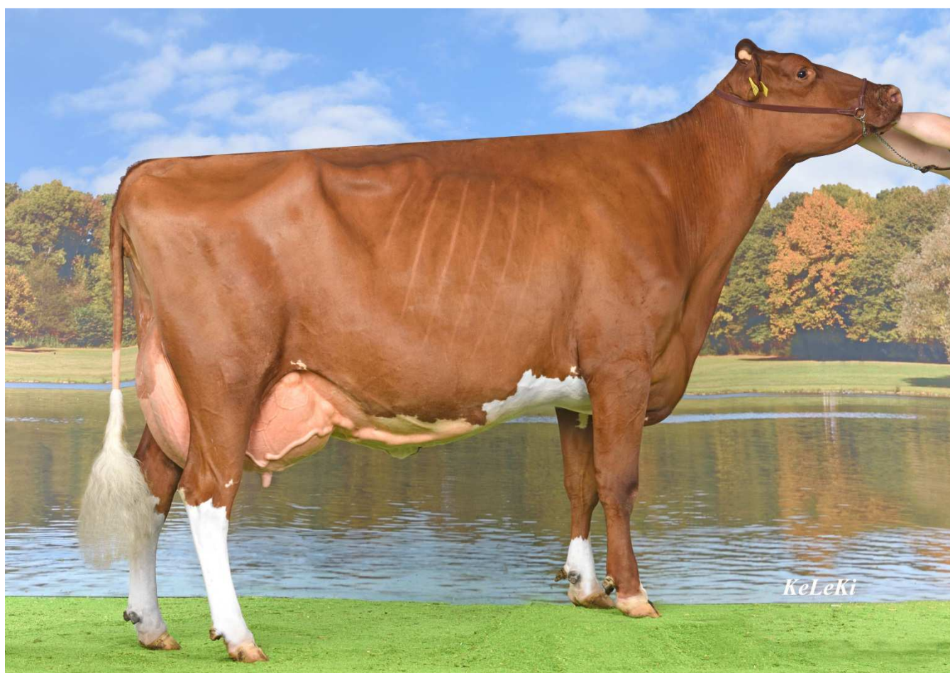
Sahara-Tochter SBH I.Red Rain (4) EX90 – 1e DHV-Schau – Spielberg Holsteins GbR